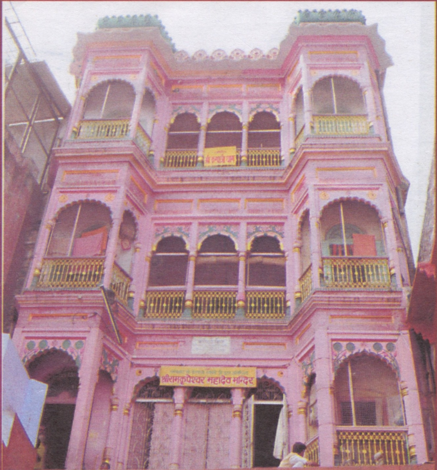
श्री करपात्री धाम श्री केदार घाट, वाराणसी