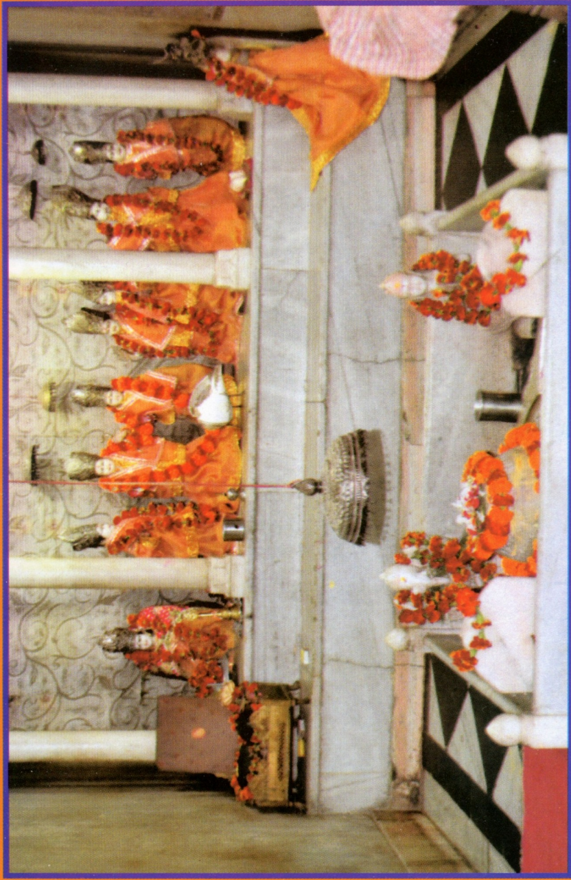
श्रीरामकृपेश्वर महादेव मन्दिर, श्री केदार घाट, वाराणसी धर्मसम्राट् श्री स्वामी करपात्रीजी महाराज द्वारा प्रतिष्ठापित